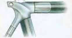
MUFFEN: Jede Aluminium Muffe wird mit präzisen Winkeln je nach spezifischer Rahmengröße gefertigt und wird, wie in der Luftfahrt, zur besseren Haltbarkeit anodisiert. Das Ergebnis: ausgewogene Rahmengenometrie, bequemes Fahren und höhere Rahmenstabilität.

Was auch immer Sie wählen, wir bieten Ihnen ein herausragendes Produkt, mit dem Sie bei der Umsetzung nach perfektem Fahrradvergnügen neue Limits realisieren werden.