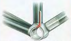
TRETLAGER: Das einzigartig geschmiedete Design bietet einen größeren Radius für jede Muffe und verstärkt die Rippen in den kritischen Punkten für einen größeren Oberflächenbereich. Diese Kriterien ergeben zusammen mit der harten Anodisierung zur Haltbarkeit, zusätzliche Kraft und Steifigkeit für eine bessere Kraftübertragung und eine höhere Seitensteifigkeit im Tretlager.