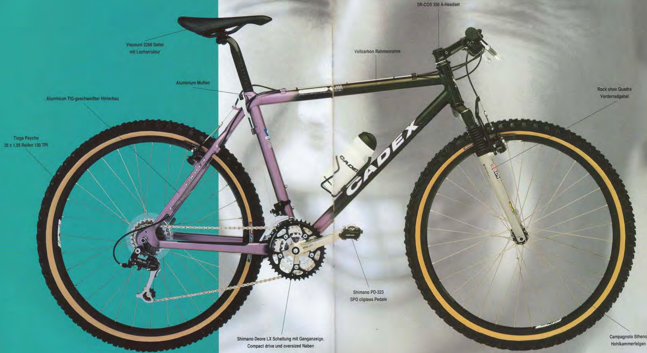
Tioga Psycho 26 x 1,95 Reifen 130 TPI