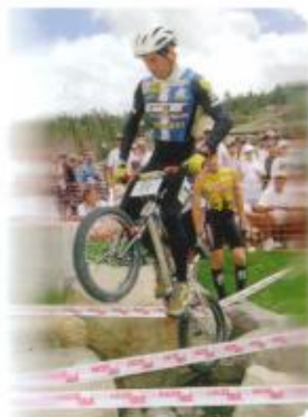
Hans „No Way“ Rey

Größen: Uni Rahmen: GT Triple Triangle Design, 7005er Series Aluminium Gabel: GT 4130 CrMo