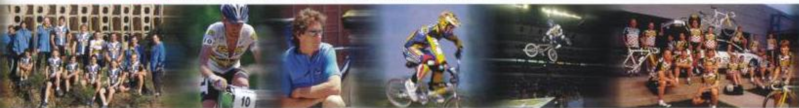
THE WORLD OF GT BICYCLES.

wie wir es machen Es wäre wie »Perlen vor die Säue werfen« , wenn wir nicht ständig das Feedback unserer hervorragenden Rennergebnisse an die Entwicklungsabteilung weitergeben würden. Die Erfahrung, die wir auf den weltweiten Rennen sammeln, verstaubt nicht in irgendwelchen Schubladen,