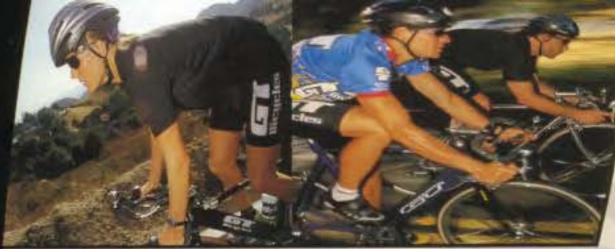
Ganz links: Triathlon Weltmeisterin Michelle Jones.