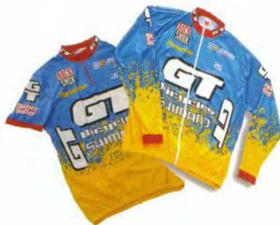
Team GT Jersey und Team GT Windjacke

Orion: Der Orion vereint viele Merkmale der anderen GT Helme, wie z.B. das „Flow-Through“ Ventilationssystem oder das außergewöhnliche Design.