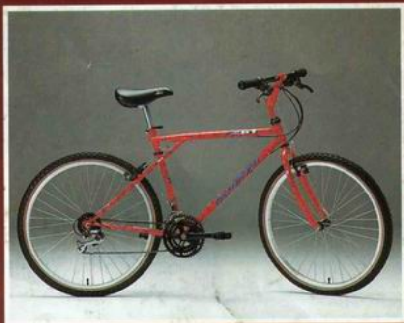
MTB GT-Outpost Tange Cromoly Rahmen, mit Suntour XCT Accushift-Komponenten DM 935,-*