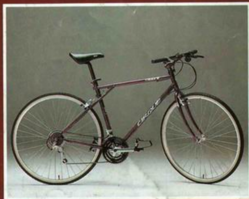
ATB Trekking GT-Cirque Tange MTB Cromoly Rahmen, Shimano 500CX-Komponenten DM 1295,-*