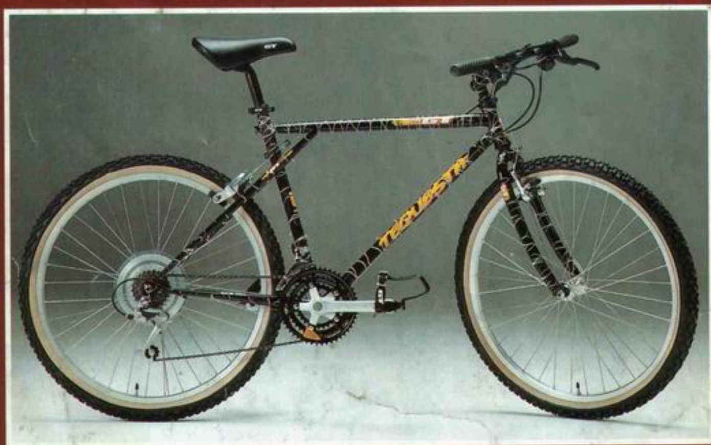
MTB GT-Tequesta Tange MTB Cromoly Rahmen, mit Shimano Deore LX-Komponenten DM 1425,-*