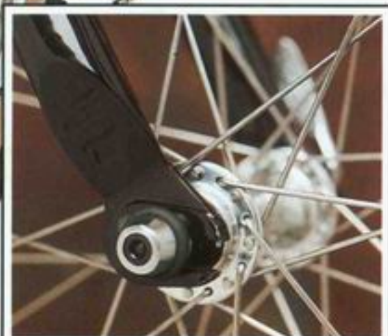
Die GT 3D™-Gabel zur Einstellung des Radstandes