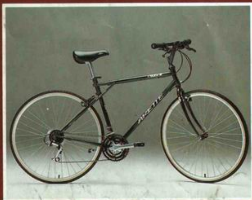
ATB Trekking GT-Arette Tange MTB Cromoly Rahmen, mit Suntour XCM Accushift-Komponenten DM 998,-*