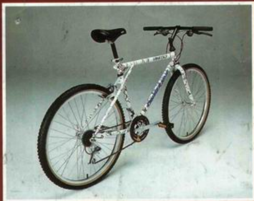
MTB GT-Timberline True Temper Cromoly Rahmen, mit Shimano 500 CX-Komponenten DM 1175,-*